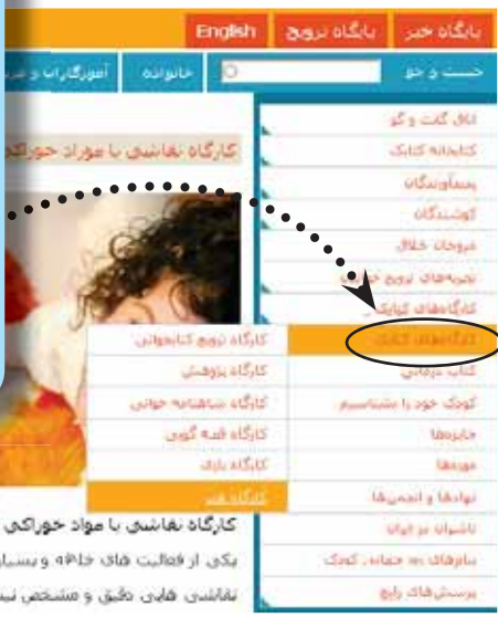
کارگاه نقاشی با مواد خوراکی (نسخه ماه تا ۲ سال) یکی از فعالیت‌های خانوادگی و بسیار جذاب برای کودکان خردسال نقاشی با مواد غذایی هاست. رنگ و منشخص نیست. حساس ساختن کودک نسبت به رنگ

برای آن‌ها که بداند چگونه با کودکان هود از نوزادی تا نوجوانی نقاشی کنید، چگونه برای آن‌ها قصه بگویید، به چه روش‌هایی با فرزندان هود بازی کنید و ده‌ها فعالیت دیگر، سری به کارگاه‌های کتابک بزنید. در سمت راست صفحه ترویج، کارگاه‌های کتابک را ببینید. نوع کارگاهی را که می‌خواهید برگزینید و با روش‌های گوناگون فعالیت با کودکان آشنا شوید.